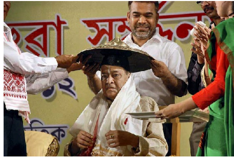
एक कार्यक्रम में संगीत सम्राट् सम्मान प्राप्त करते हुए

स्वयं अपने गीत लिखकर, उन्हें गीत बताकर गानेवाले भूपेन ने 'विश्व निर्जोय नोजवान' में पहला गान गाया और फिर इसके बाद संगीत और भूपेन मानो परस्पर पर्याय हो गए। उन्होंने असमिया चलचित्र की दूसरी फिल्म 'इंद्रमालती' के लिए भी कार्य किया। तेरह वर्ष की आयु में तेजपुर से मैट्रिक की परीक्षा उत्तीर्ण करने के पश्चात् वे आगे की शिक्षा के लिए गुवाहाटी चले गए। सन् 1942 में वहाँ के कॉटन कॉलेज से इंटरमीडिएट करने के बाद उन्होंने बनारस हिंदू विश्वविद्यालय से राजनीति विज्ञान में एम.ए. किया। आगे की पढ़ाई के लिए वे विदेश भी गए तथा कोलंबिया विश्वविद्यालय से पी-एच.डी. की डिग्री प्राप्त की। उन्हें शिकागो विश्वविद्यालय ने भी फेलोशिप प्रदान की। वे दक्षिण एशिया के सांस्कृतिक राजदूत कहलाते थे।