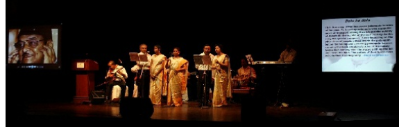
विभिन्न असमी गायक डॉ. भूपेन हजारिका को श्रद्धांजलि देते हुए

तत्कालीन प्रधानमंत्री मनमोहन सिंह ने भूपेन हजारिका के निधन पर गहरा शोक प्रकट करते हुए कहा कि डॉ. हजारिका के निधन से देश ने अपना एक महत्वपूर्ण कलाकार खो दिया। उनकी प्रतिभा केवल संगीत एवं साहित्य तक सीमित नहीं थी, बल्कि अभिनय, फिल्म निर्देशन आदि तमाम क्षेत्रों में भी अपनी उपलब्धियों के साथ वे एक संपूर्ण व्यक्तित्व थे।