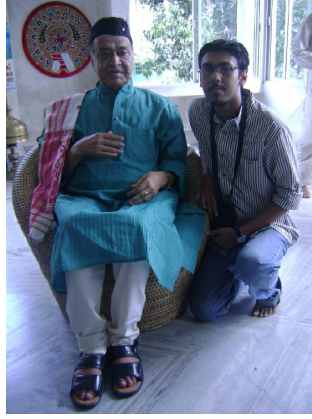
अपने एक फेन के साथ भूपेन