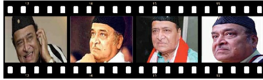
भूपेन हजारिका विभिन्न भावों में

ये पंक्तियाँ पढ़ते ही अचानक भूपेन हजारिका का गुरु गंभीर स्वर कानों में गूँज उठता है। अपनी स्वरलहरियों से श्रोताओं को मंत्रमुग्ध कर देने की क्षमता रखनेवाले भूपेन हजारिका का नाम किसी परिचय की आकांक्षा नहीं रखता। भूपेन हजारिका ऐसे लोकनायक थे, जिनके गीत पूर्वोत्तर भारत की जनता की धमनियों में रक्त के साथ घुले हुए हैं।