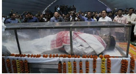
डॉ. भूपेन हजारिका की अंत्येष्टि के दिन

फिल्म रुदाली के लिए उनका गीत 'दिल हूम हूम करे...' भला कौन भुला सकता है। 'ऊँचे नीचे रास्तों पर काँधे लिये जाते हैं... राजा-महाराजाओं का डोला, डोला... रे डोला...' हो या फिर उनके भावपूर्ण स्वर में गाया गया प्रिय गीत 'सागर संगम में कितना तैरा मैं... फिर भी मैं थका नहीं...' सभी गीत केवल यही सोचने पर विवश कर देते हैं कि क्या कभी उनके निधन से बने शून्य को भरा जा सकेगा?