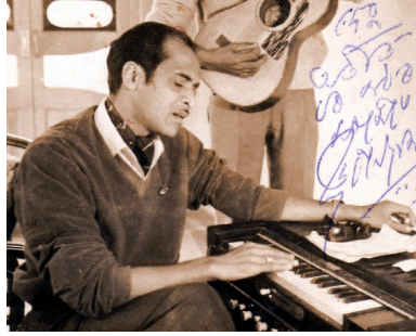
युवा भूपेन हजारिका वाद्य यंत्र पर अभ्यास करते हुए

भूपेन ने बचपन में ही अपना पहला गीत लिखा और दस वर्ष की आयु में उसे गाया भी। अपने आसपास के वातावरण ने ही उनमें लोकसंगीत के प्रति रुझान पैदा किया, क्योंकि वे उसी के बीच बड़े हुए थे। वे आदिवासी संगीत को ही अपने गायन का श्रेय देते थे। अपनी माँ की लोरियों से भी उन्हें गायन की प्रेरणा मिली। उनकी माँ बड़ी मीठी लोरियाँ सुनाती थीं। बाद के वर्षों में उन्होंने फिल्म 'रुदाली' में उस लोरी का उपयोग भी किया था।